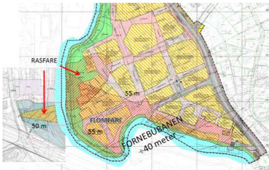
Planforslagene for Lysakerelvas nedre del satt sammen av Mustad Eiendoms plantegninger innsendt til Oslo og Bærum

Ei sunn elv krever plass og sollys. Politikerne må sette seg inn i kravene og ikke blendes av MEs pengebidrag til finansiering av Fornebubanen.