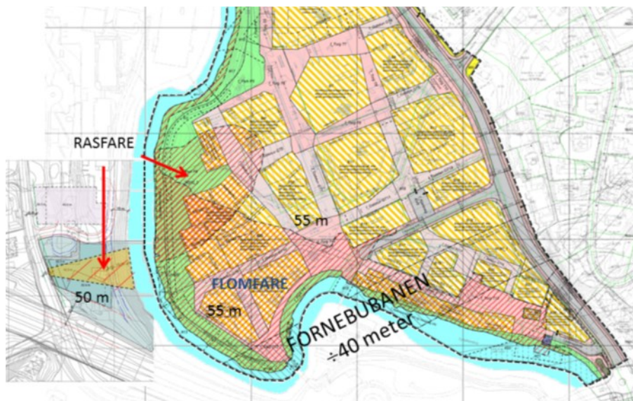
Planforslagene for Lysakerelvas nedre del satt sammen av Mustad Eiendoms plantegninger innsendt til Oslo og Bærum

Ei sunn elv krever plass og sollys. Politikerne må sette seg inn i kravene og ikke blendes av MEs pengebidrag til finansiering av Fornebubanen.